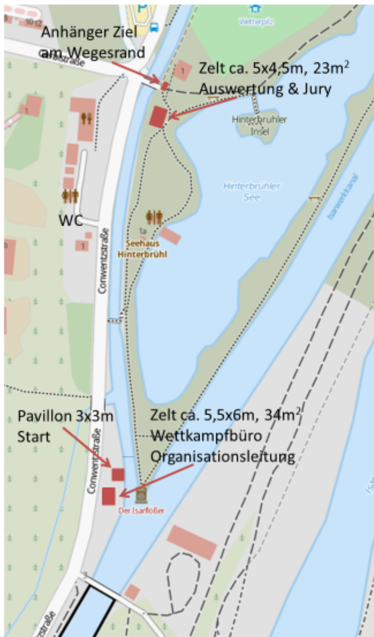
Lageplan Sprint und Slalomstrecke